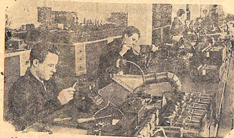
Московский завод «Комета» Министерства тяжелого машиностроения СССР с 1956 года начал выпускать новый вид продукции — средства автоматизации теплоэнергетических установок.

В этом году будет освоено производство всех видов систем автоматизации, применяющихся в настоящее время для регулирования работы котельных установок: электронной — для крупных установок, электромеханической — для котлов средней мощности и электрогидравлической — для котлов малой мощности.